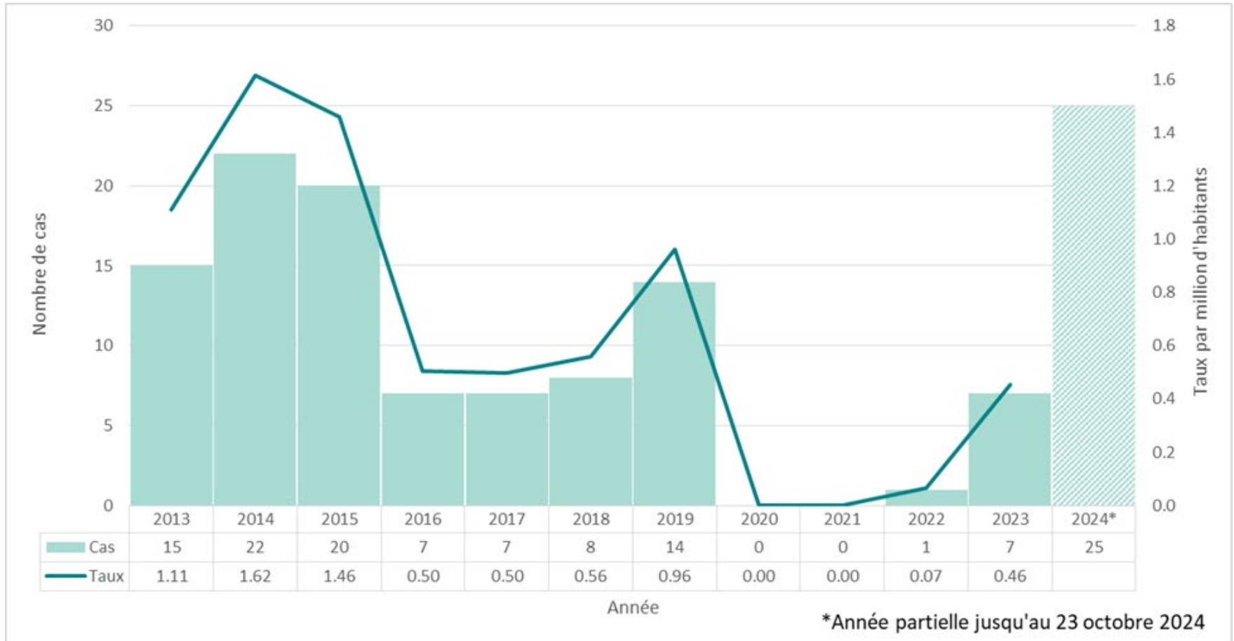
Figure 2 : Nombre de cas de rougeole et taux d'incidence par million d'habitants, Ontario, du 1 er janvier 2013 au 23 octobre 2024