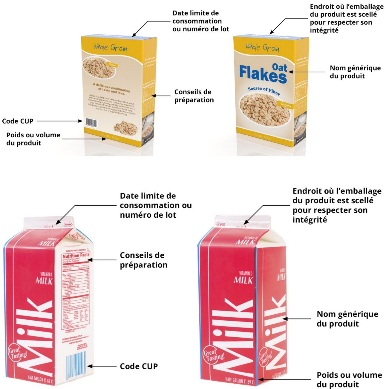
Figure 3. Boîte de céréales et carton de lait avec des renseignements sur le produit sur les différents côtés de l'emballage.